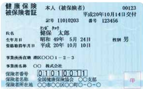
【切替後の被保険者証の見本】