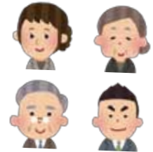
新規採用者リスト

パートの加入者は、1日または1週の労働時間、1ヶ月の労働日数が常勤者の概ね4分の3以上勤務することが目安となりますが、平成28年10月以降は「週20時間以上勤務する」などに加入基準の変更が予定されています。