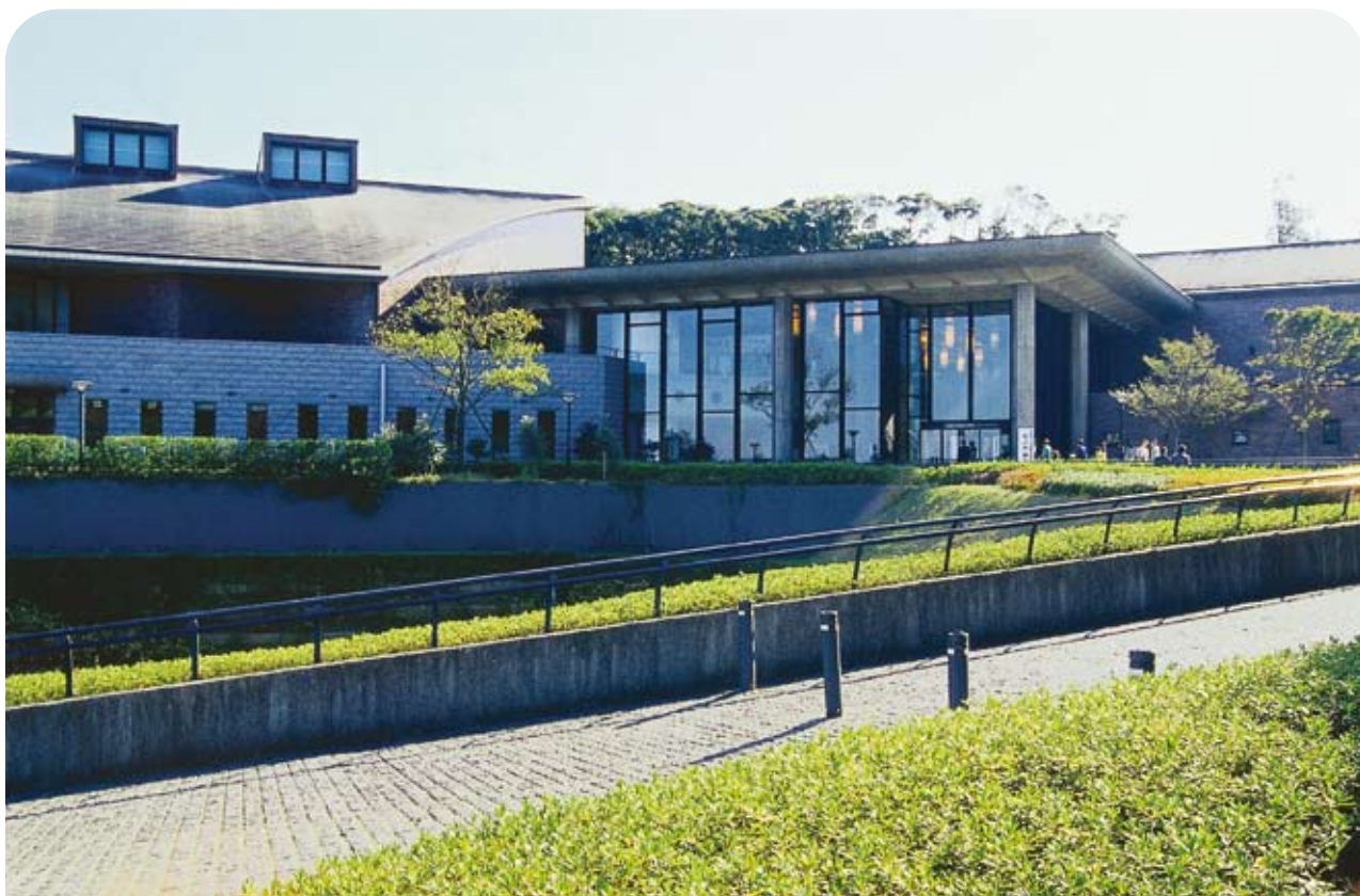
■唐津市 名護屋城博物館