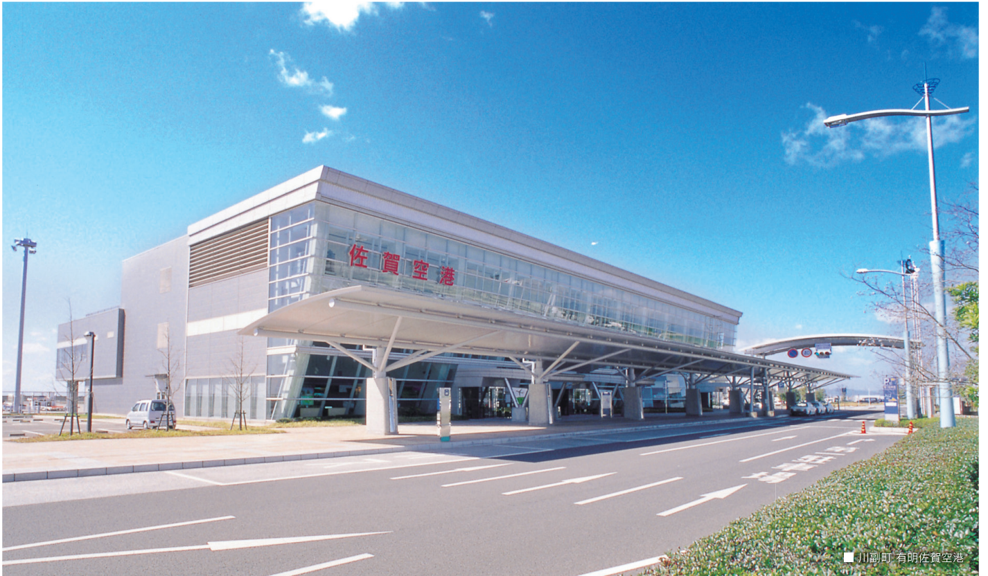
川副町 有明佐賀空港