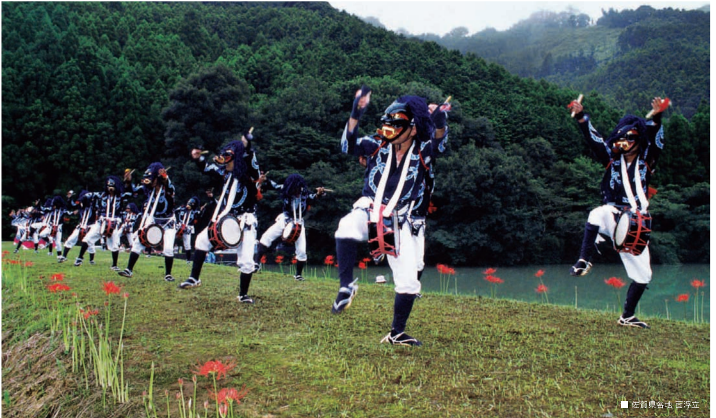
■佐賀県各地 面浮立

〒840-0816佐賀市駅南本町6-4 佐賀中央第一生命ビル9階 TEL.0952-26-3171 FAX.0952-26-3377 http://www.syahokyo-saga.or.jp/