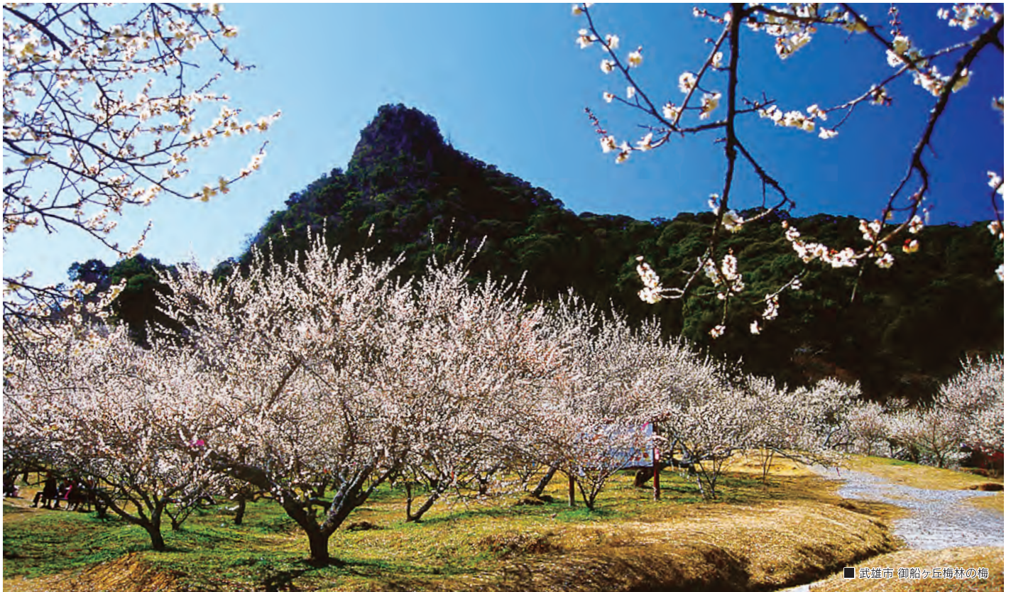
■ 武雄市 御船ヶ丘梅林の梅