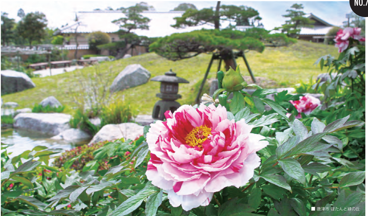
■ 唐津市 ほとんと緑の丘