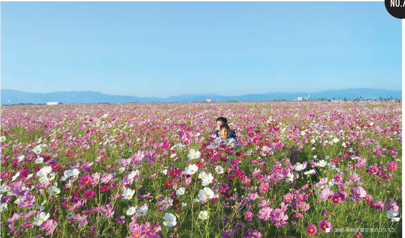
■川副町 有明佐賀空港のコスモス