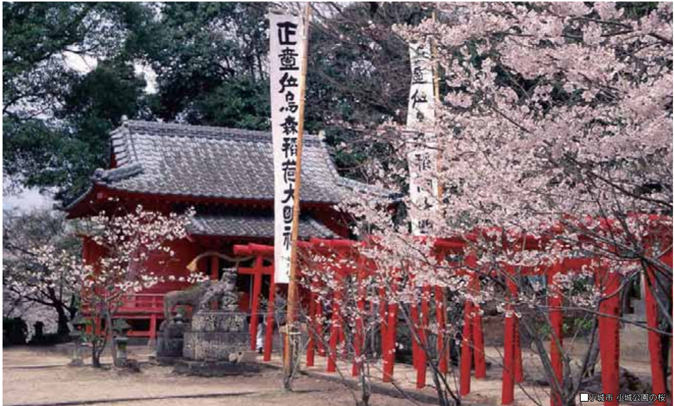
小城市 小城公園の桜