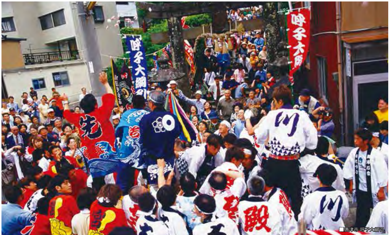
唐津市 呼子大綱引