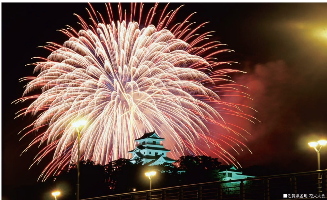
■佐賀県各地 花火大会