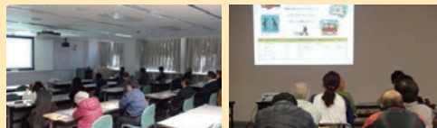
健康づくりセミナーの様子(平成26年2月開催) 当協会の保健師・管理栄養士が講演を行ったほか、歯科医師を講師にお招きし、歯周病予防についての講演を行いました。