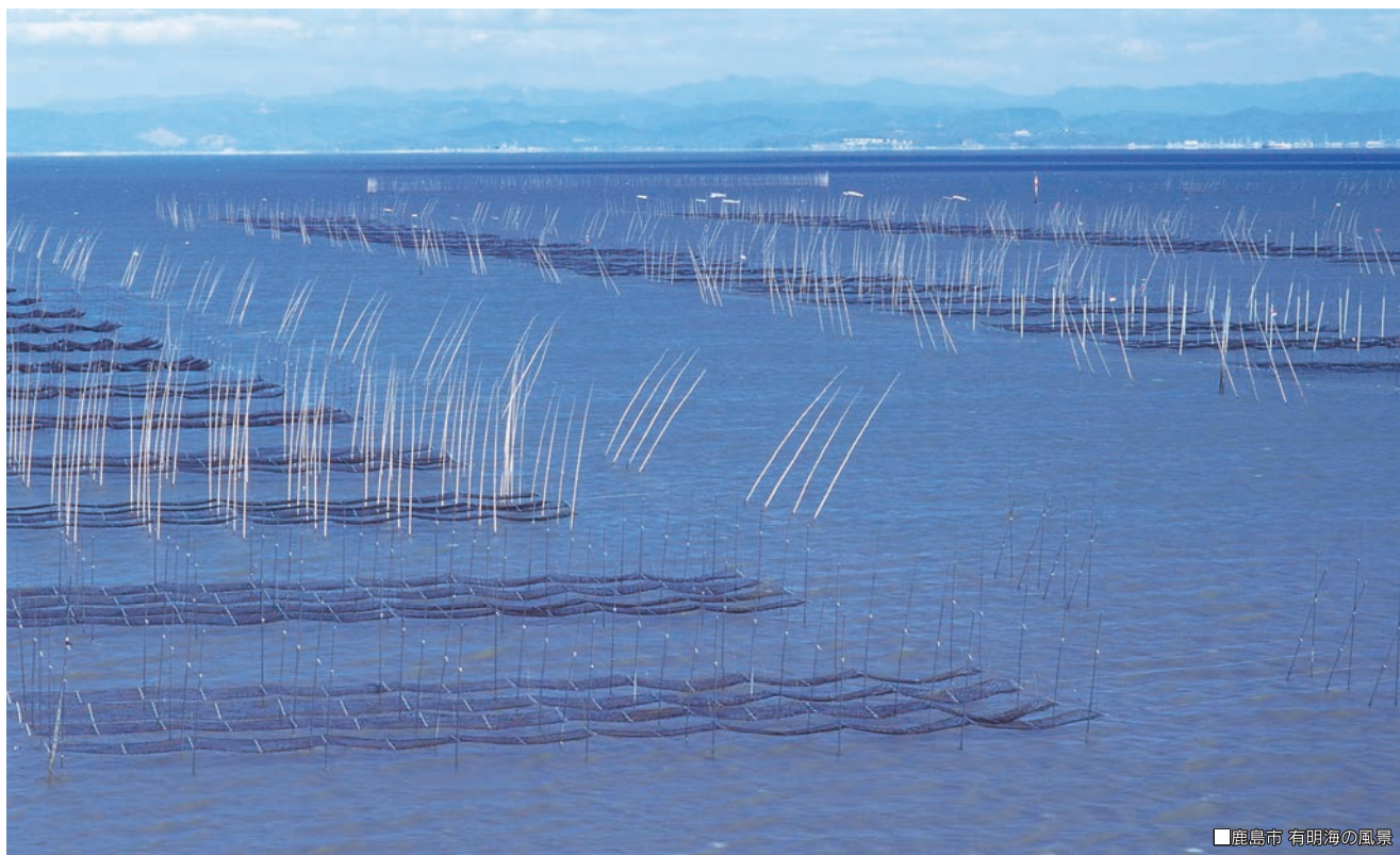
■鹿島市 有明海の風景