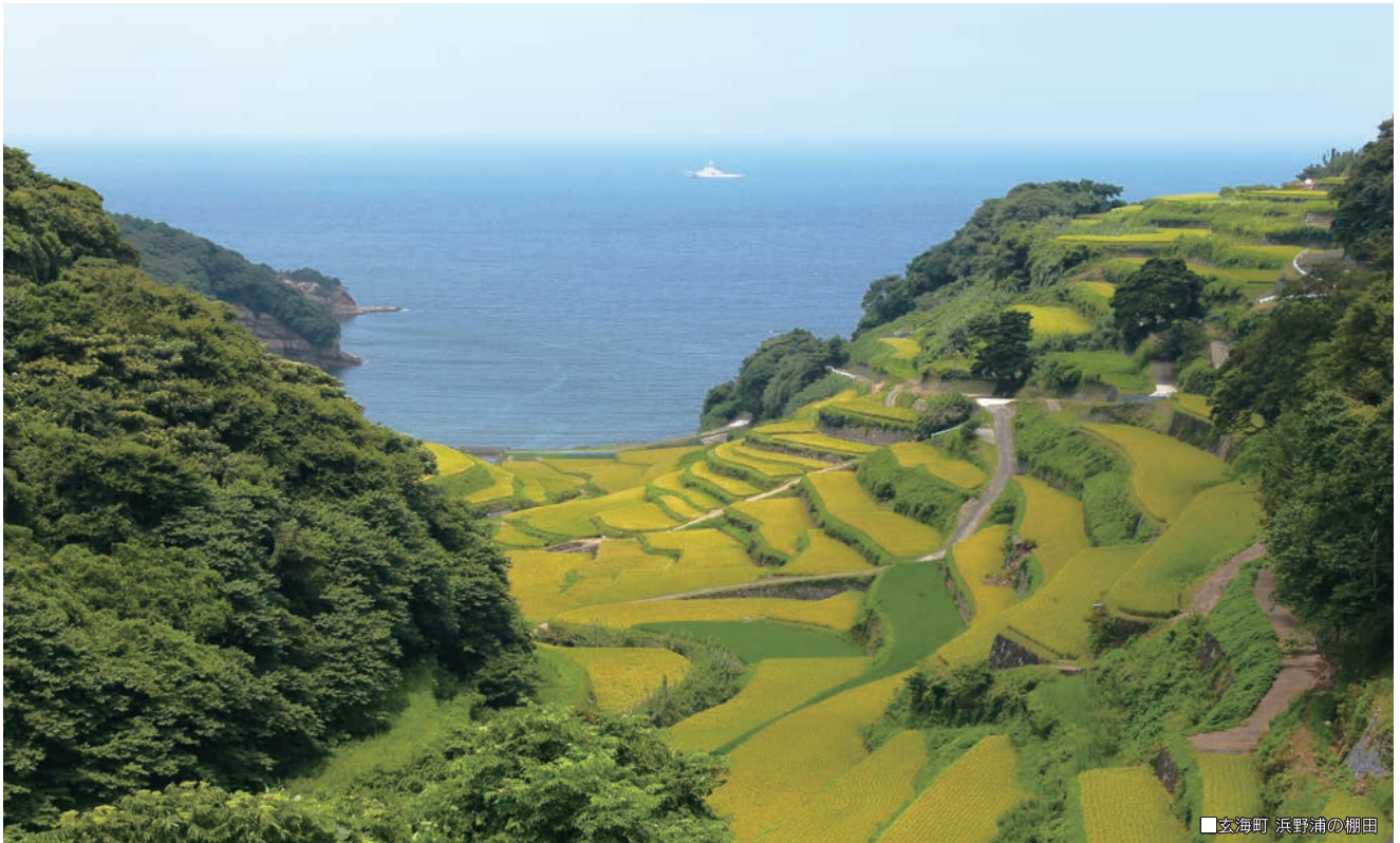
■玄海町 浜野浦の棚田