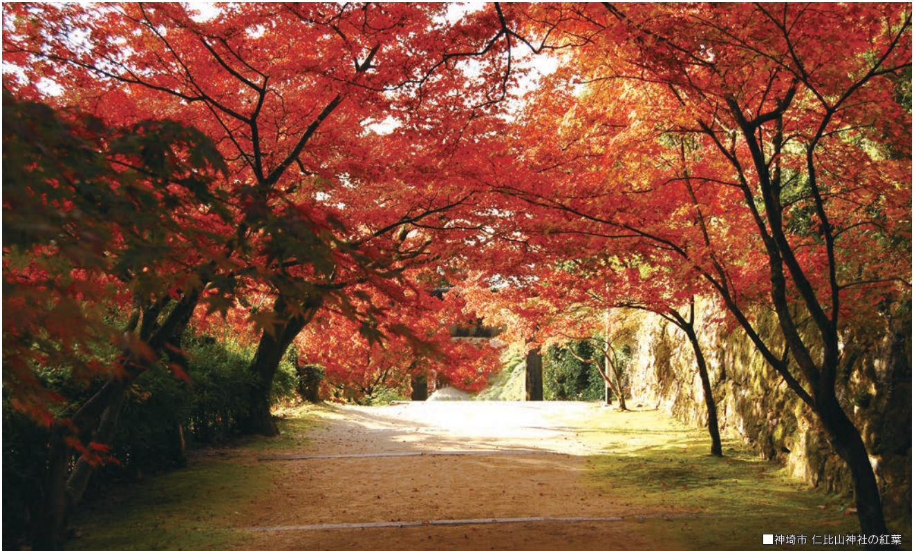
■ 神埼市 仁比山神社の紅葉