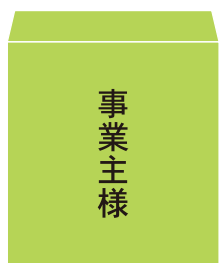
みどり色の封筒 (概ね角2サイズ)