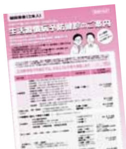
ピンク色のパンフレット