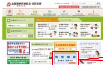
協会けんぽ佐賀支部ホームページ

ご利用可能な健診機関については、 協会けんぽ佐賀支部のホームページ 、もしくは、 受診券と一緒に同封されている「案内」 をご確認ください。