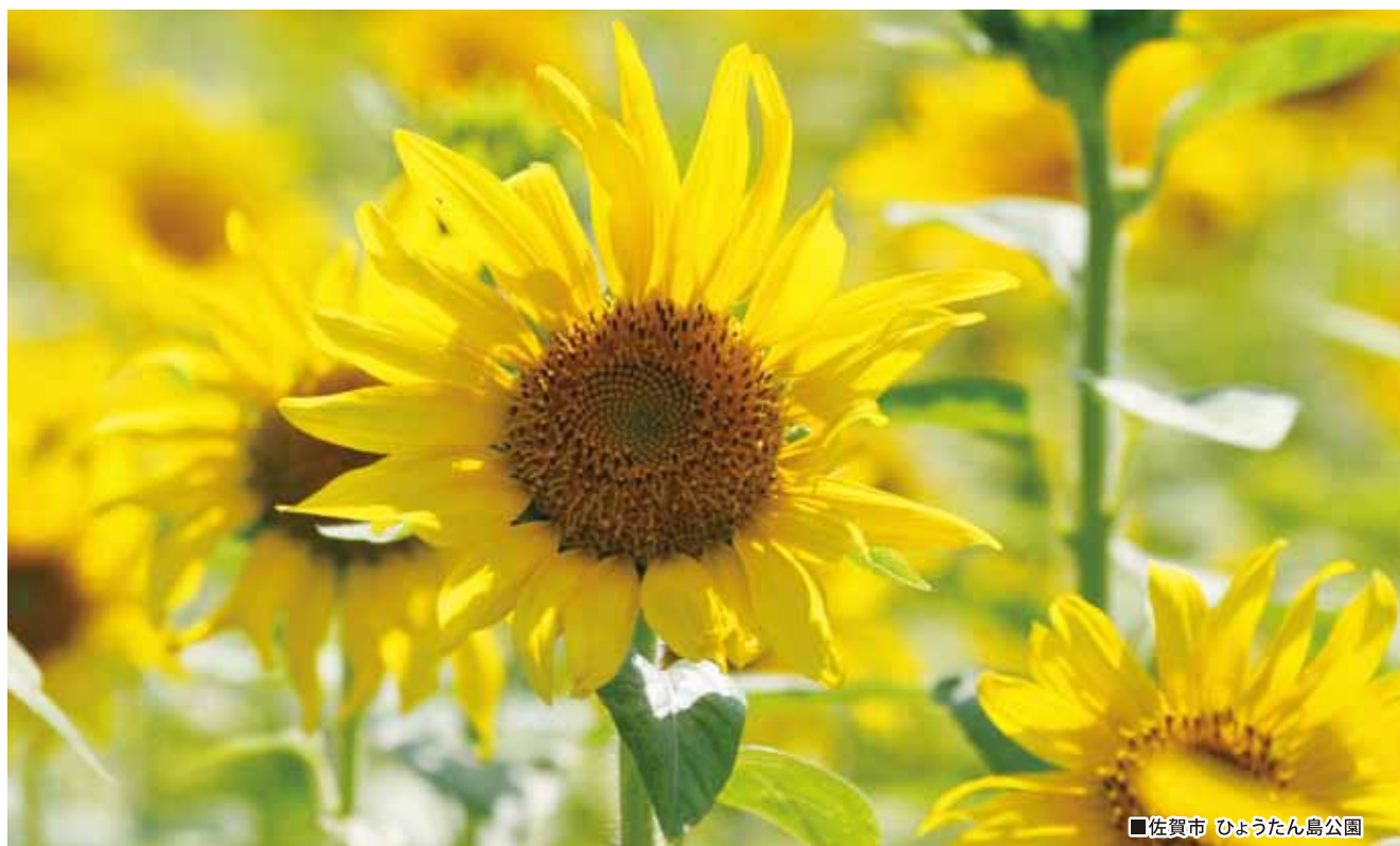
■佐賀市 ひょうたん島公園