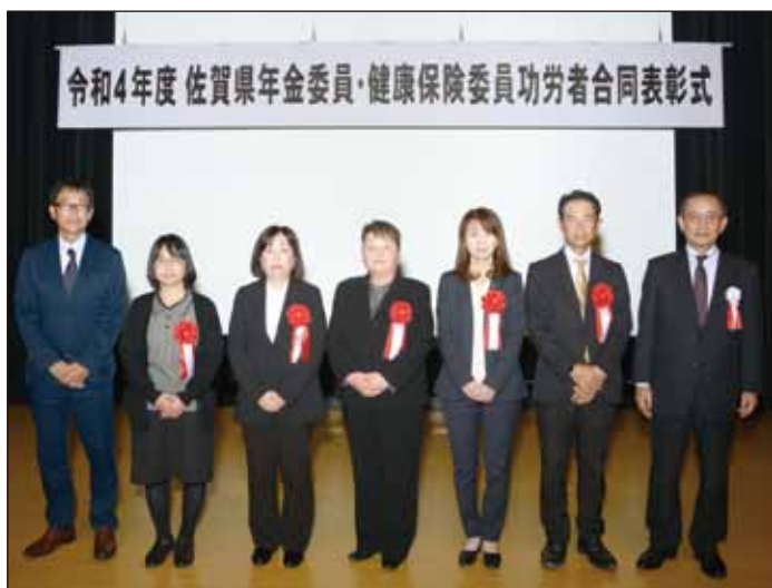
表彰対象者名順に掲載