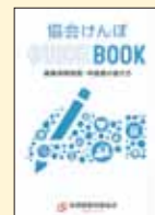
協会けんぽのしおり

事業所の社会保険事務担当者で登録がまだお済みでない方は、協会けんぽ佐賀支部のHPに掲載している登録用紙にてご登録をお願いいたします。また、健康保険委員への特典として、制度周知用冊子や季節の健康情報冊子を配布しております。