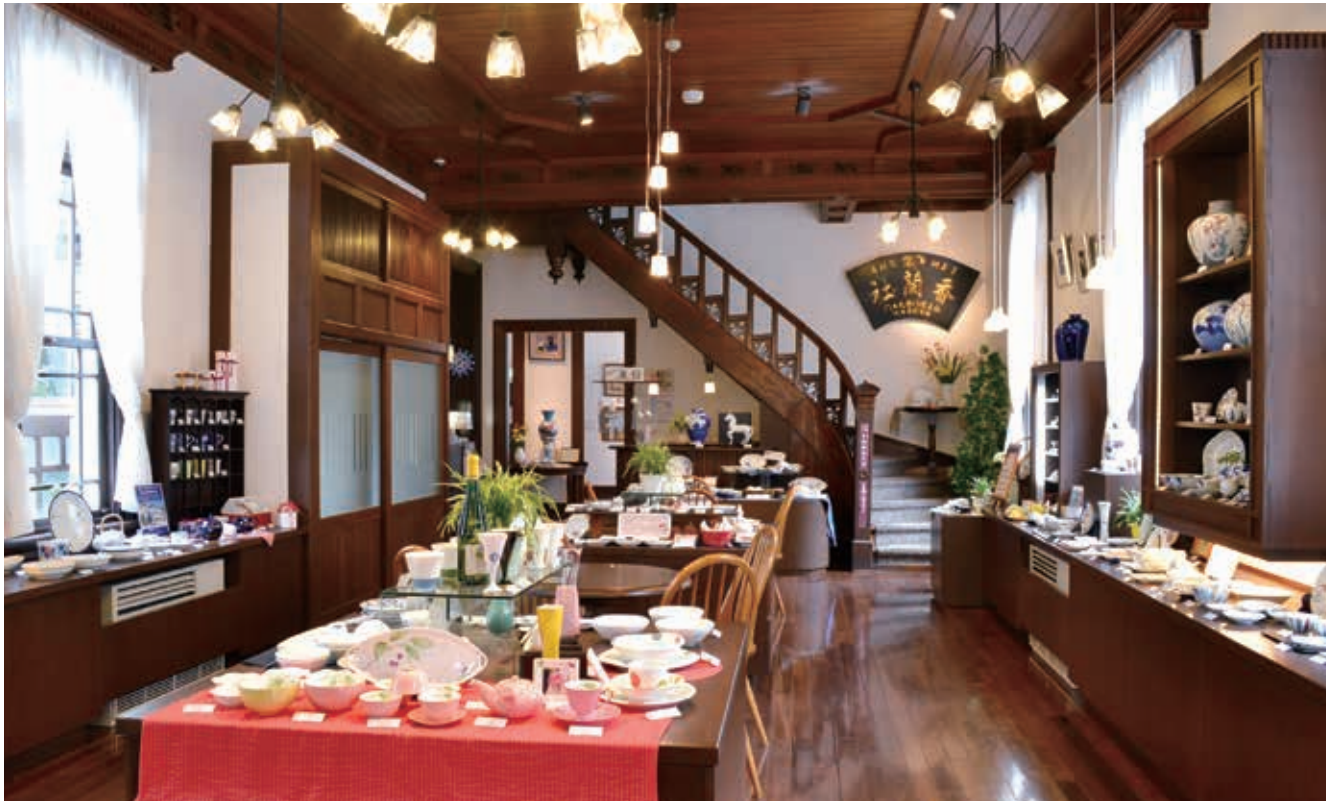
株式会社 香蘭社 有田本店ショールーム