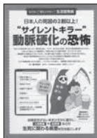
健康保険委員への特典