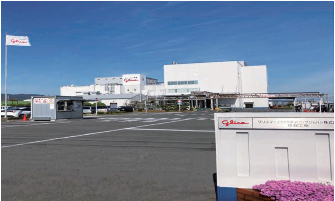
グリコマニュファクチャリングジャパン株式会社 佐賀工場