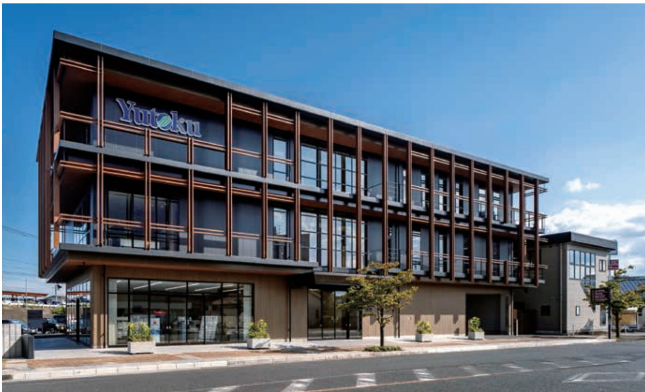
祐徳自動車株式会社 本社