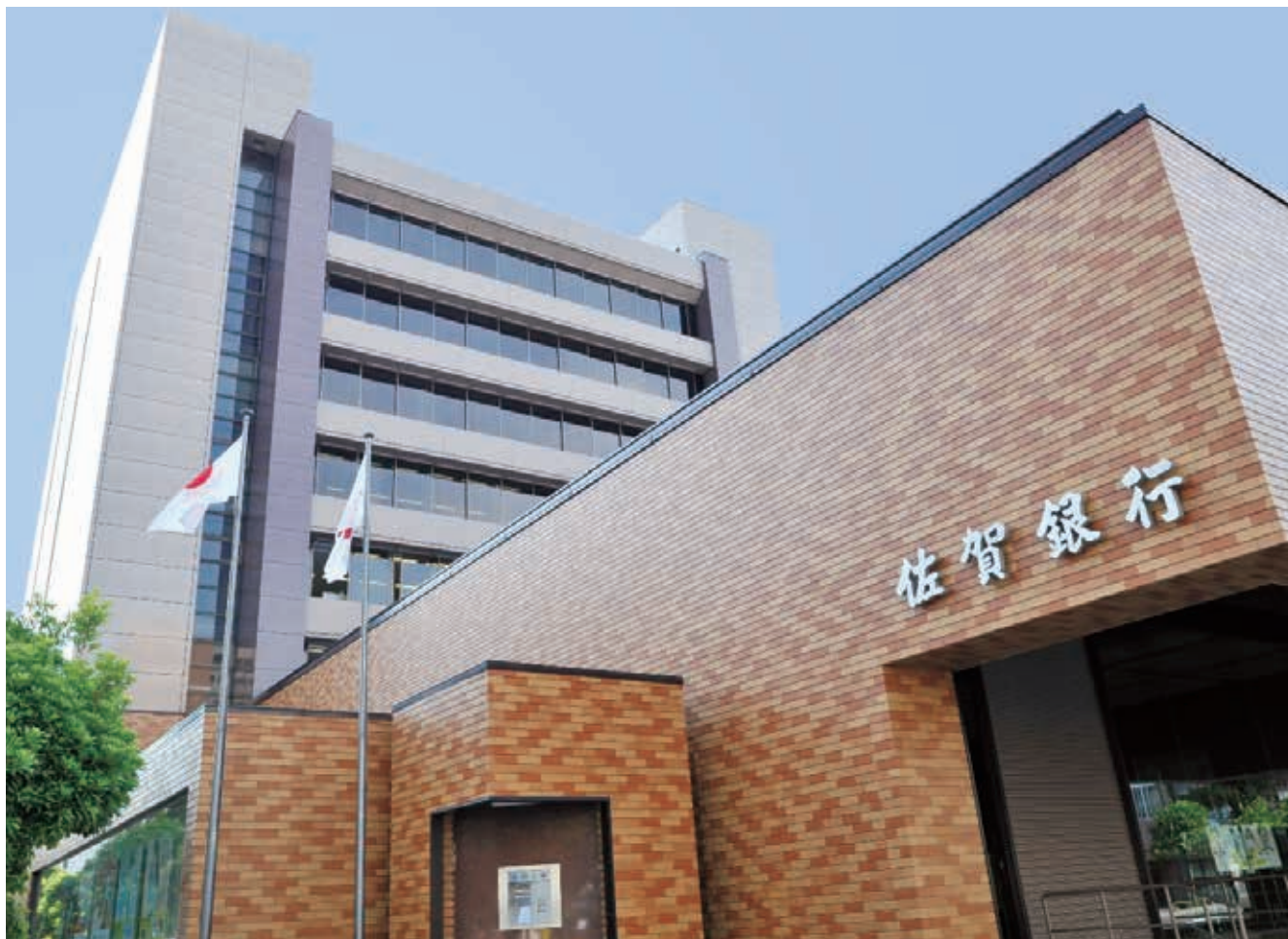
■株式会社 佐賀銀行本店

・年金相談窓口開設カレンダー等 ・令和7年「健康づくりカレンダー」申込みの受付を開始します!