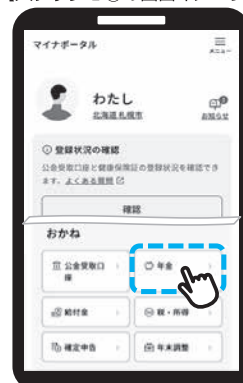
【ステップ1③の画面イメージ】