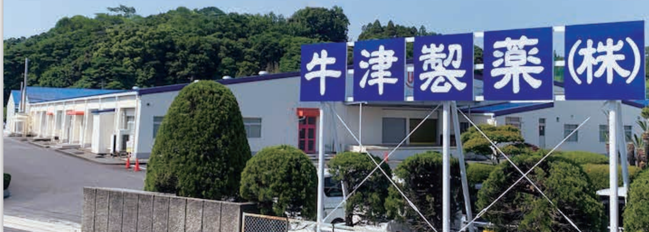
■牛津製薬(株) 本社・工場