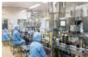
徹底した製造管理・品質管理

牛津製薬株式会社は、1948年（昭和23年）に創業、レバコールは1962年（昭和37年）に発売を開始しました。鹿児島県では昔から鰯の内臓を塩辛にし、お酒の肴「酒盗（しゅとう）」として食されていました。「鰯の肝臓は、人の肝臓にも良いのではないか？」という事から九州大学他で研究され、レバコールの主成分である「カツオの肝臓エキス」が開発されました。そのカツオの肝臓エキスは、ギリシャ語のALL（すべての）を意味する「パン」と肝臓の「レバー」から「鰯の全てがここにある」という意味を込めて、私たち牛津製薬が「パンリバー」と名付けました。その後、原料のカツオ肝臓エキス「パンリバー」から、ビタミン含有保健薬「レバコールシリーズ」へと繋がって行きます。牛津製薬の『工場訓』の中に、「私達は、人々の・・・」という言葉があります。昭和、平成、令和と続くこの時代の中で、医薬品と健康食品の製造と販売を通じて、人々の「元気」と「健康」のお手伝いができることに、誇りと責任を持って、日々の業務にあたりたいと思っています。これから5年10年～50年と、地元の人たちに長く愛される会社でありたい。もちろん全国のご愛用者様にも、変わらぬご愛顧をいただけるような会社でありたい。社員全員がそう願って、日々の業務に精励する所存です。