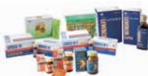
日々の健康に奉仕する医薬品等