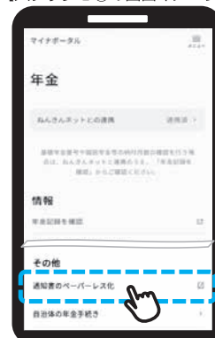
【ステップ2の画面イメージ】