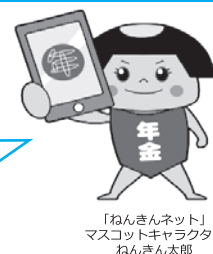
「ねんきんネット」 マスコットキャラクター ねんきん太郎